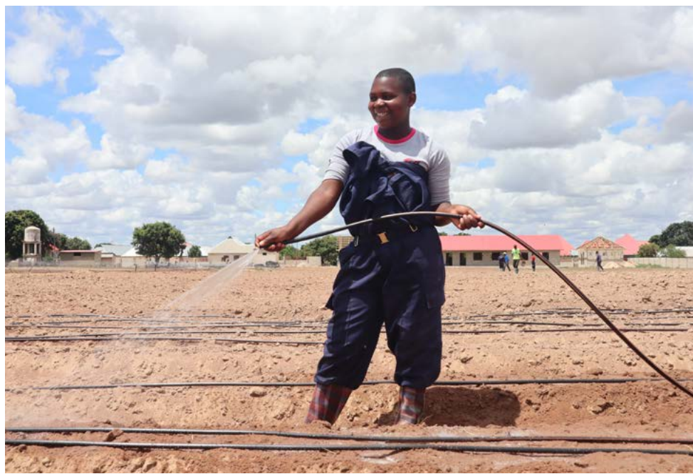
Photograph: Tal Aboulafia